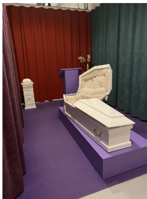
Beelden van de tentoonstelling Living Loonger in De Studio, dependance van het Nemo Science Museum