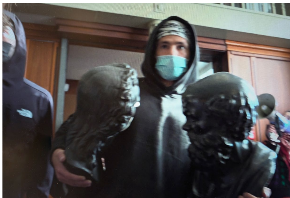
Gemaskerde demonstrant met links het nu vermiste beeld van Schiller en rechts de kop van Socrates in de voormalige Amsterdamse Academische Club.

Hoewel er in veel UvA-gebouwen kunst hangt, werden er alleen in de Academische Club kunstwerken vernield. Met een slag om de arm is reeds geschetst wat er zoal hing en stond. Het Allard Pierson draagt zorg voor het verspreide erfgoed van de UvA. Het is dan ook gebruikelijk om bij verbouwing of sluiting van een universitair gebouw uit veiligheidsoverwegingen objecten van kunst en wetenschap terug te halen. De voorstudie van het portret van Gevers en de bronzen borstbeelden op de schoorsteenmantel zijn na sluiting van de Academische Club weggehaald, maar doordat toen de gepatineerde borstbeelden nog niet konden worden ►