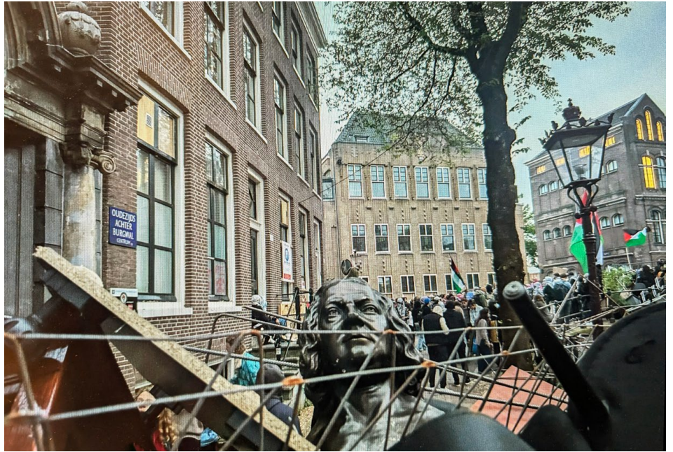
Beeld van de zogenaamde Voltaire is boven op de barricade beland bij de ingang van de Oudemanshuispoort en moet als vermist worden beschouwd.

Het verhaal gaat dat de demonstranten dachten dat deze koppen VOC-bestuurders voorstelden – de VOC, die wel omschreven is als de eerste multinational ter wereld. Maar konden de demonstranten zich überhaupt voorstellen dat zich in een academisch gebouw beelden kunnen bevinden van mensen met een filosofisch of wetenschappelijk belang, in plaats van 'verderfelijke kapitalisten' te representeren? (Een vergelijkbare mindset leken de demonstranten in het Rooterseilandcomplex erop na te houden, die – naar wordt gezegd – het marmeren beeld van Minerva bewust niet hebben aangetast, omdat het om een vrouw ging.) In tegenstelling tot acties van Extinction Rebellion, waar kunstwerken werden beklad om aandacht te vragen voor hun zaak zonder die daadwerkelijk te beschadigen is bij de acties op de UvA sprake geweest van moedwillige vernieling.